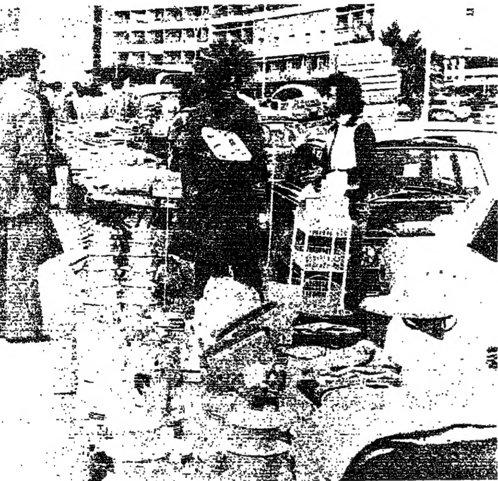
■ أدوات منزلية بين العرض والطلب

■ من الحيرا - إلى العنائم - التي الرؤشة آخر... هكذا تنقل البسطات في طرق سائكة وآمنة. مئات الباعة والوف السيارات والسارات - ازدحموا بين شوارع والرؤشة أين يعرضون ويعرضون وكانهم على بعد السوف